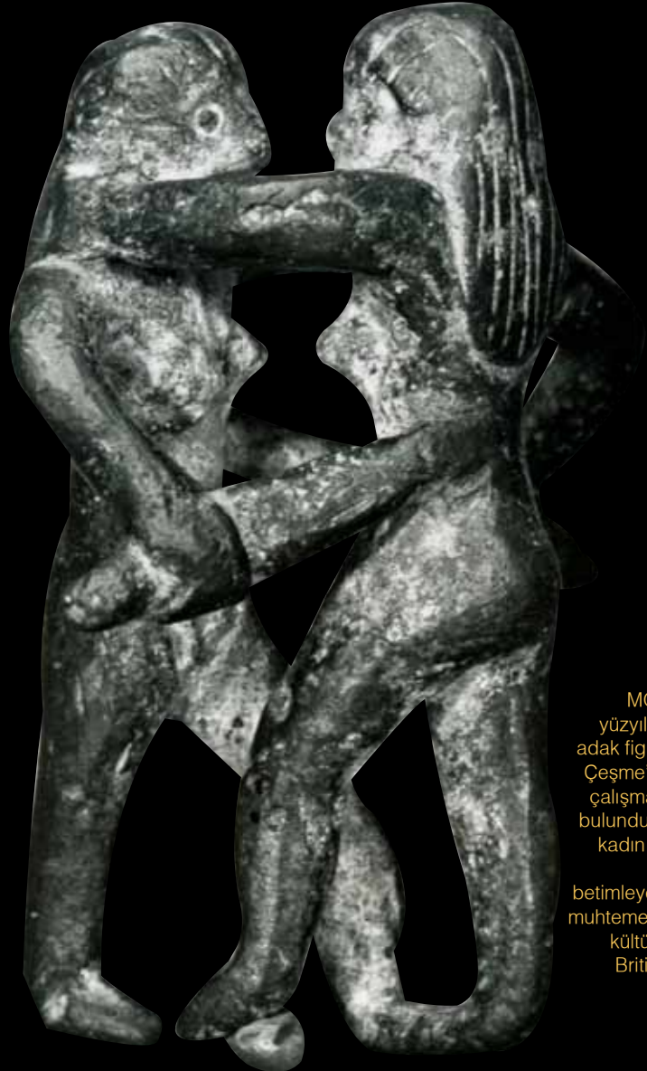
MÖ yaklaşık 6. yüzyıla ait olan bu adak figürünün İzmir Çeşme'deki bir kazı çalışması sırasında bulunduğu bilinir. İki kadın gladyatörün dövüşünü betimleyen bu figürin muhtemelen verimlilik kültürü ile ilişkilidir. British Museum.

nu hayranı olabileceğini de düşünmektedir. Kimisi ise Anubis'in yoldaşı İsişe tapınılan popüler bir Mısır kültürünün müridi olduğunu öne sürer. Peki, Great Dover Sokağı Kadını bir gladyatör müydü? Ne yazık ki bu sorunun gerçek cevabı bilinmemektedir. Kesin olarak bilinen ise, kadınların antik Roma arenasında dövüştüğü, muhtemelen can verdiği ve antik dünyanın en kalıcı görüntülerinden birinin parçası olduğudur: GLADYATÖR ■