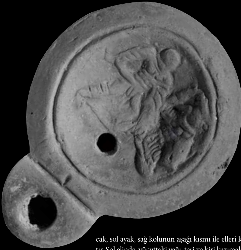
Knidos'ta Demeter Kutsal Alanında bulunan bu kandilin diskus kısmında iki kadın gladyatör betimlenmiştir. Knidos üretimidir. MS 2. yüzyıl. British Museum.